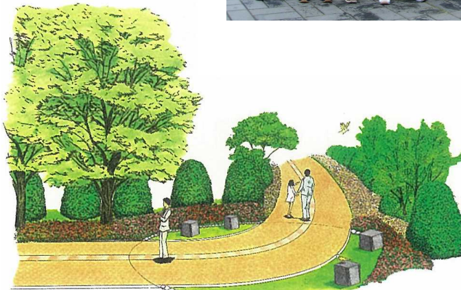
ふれあい緑道(緑のアクセスゾーン)